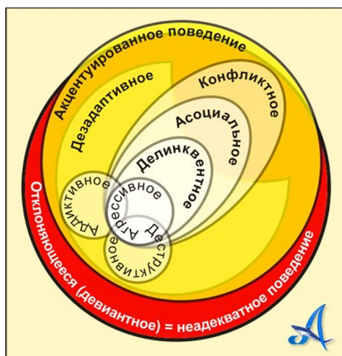
Рисунок-схема поведенческих нарушений учащихся «группы риска»

Правовые аспекты психологического сопровождения детей группы риска, воспитывающихся в семьях, находящихся в социально опасном положении: